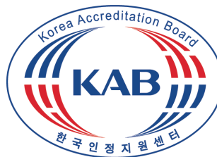
한국인정지원센터 Korea Accreditation Board

에이써티는 앞으로도 더욱 더 철저한 법규와 규정의 준수, 공정한 업무 수행 및 고객 만족 증진을 위해 성실과 정성으로 그리고 끊임없는 시스템의 연구 개발을 바탕으로 국내 최고 인증 기관으로써 명성을 얻을 수 있도록 각고의 노력을 하고 있습니다.