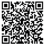
< IAF 승인 >