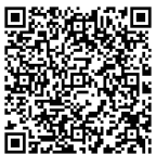
< KAB 승인 >